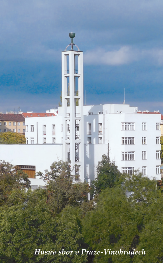
Husův sbor v Praze-Vinohradech